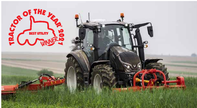
Le tracteur G135 Versu équipé de l'accoudeur SmartTouch a été élu meilleur tracteur polyvalent du concours Tractor of the Year.