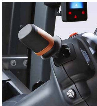
Le levier d'inverseur de marche traditionnel a été perfectionné.

Les modèles T145 et T155 sont équipés d'un moteur AGCO Power 6 cylindres 6,6 litres. Les modèles T175–T255 possèdent un moteur AGCO Power 6 cylindres 7,4 litres. Transmissions HiTech, Active, Versu et Direct, sauf pour le T255 où le modèle Direct à variation continue n'est pas disponible.